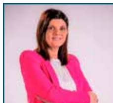
CONCETTA CURIALE Presidente del Consiglio Comunale con delega in Materia di Comunicazione Istituzionale